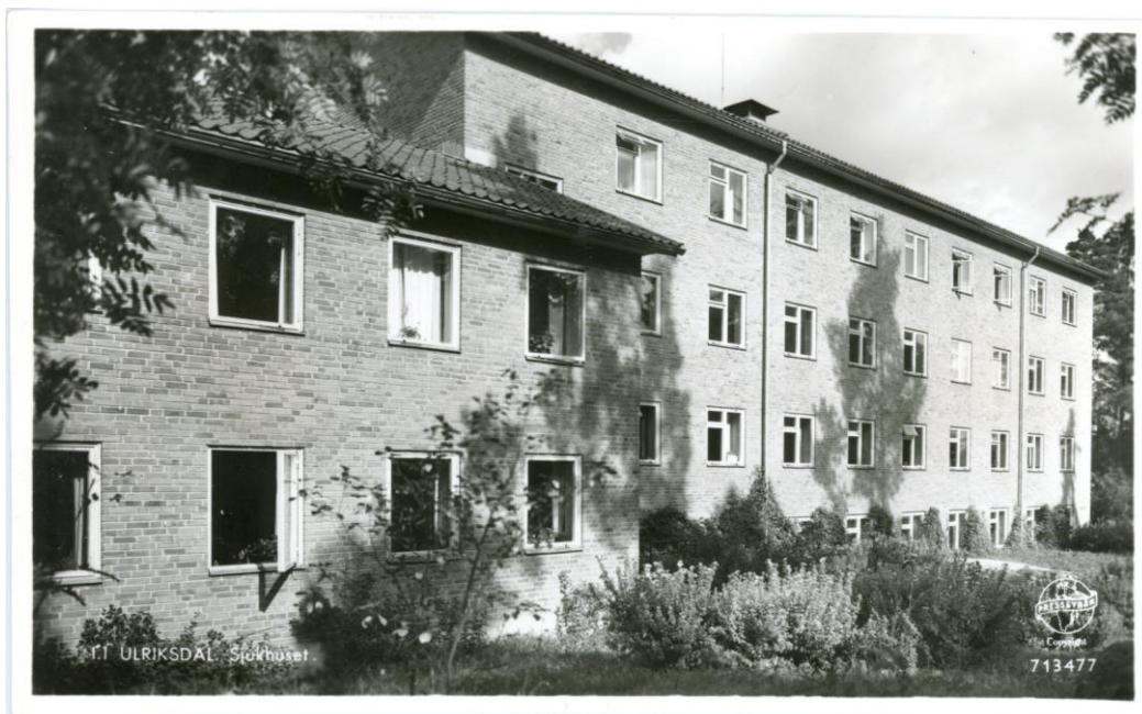
Kort från början av 1950-talet. Oskrivet och ostämplat; Pressbyrån 713477

I samband med den så kallade Mälarkarusellen beslutades att regementet skulle omlokaliseras till den egendom som tillhörde Granhammars slott i Upplands-Bro kommun. Den 18 april 1970 hölls en avflyttningsceremoni och den 30 juni 1970 lämnades Sörentorp officiellt.