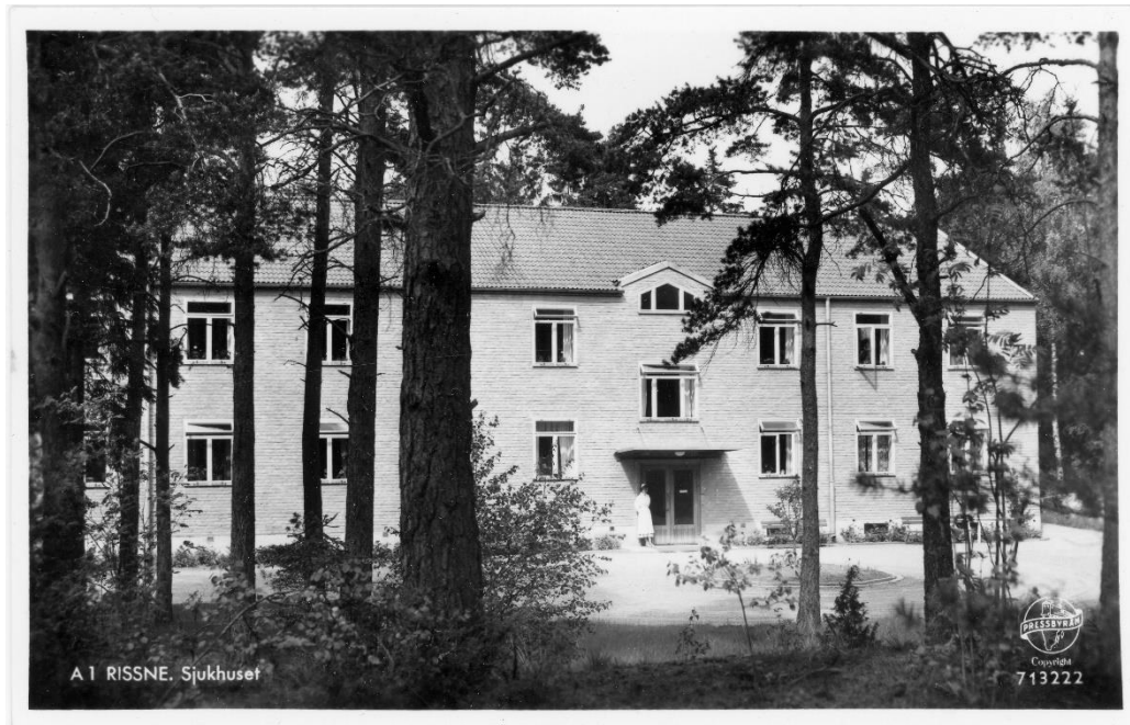
Kort från början av 1950-talet. Oskrivet och ostämplat; Pressbyrån 713222