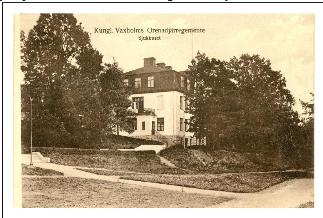
Kort från början av 1910-talet. Oskrivet och ostämplat; Imp. S 51068

Stenhuset som rymde nya sjukhuset uppfördes omkring 1908, byggdes till på 1940-talet och byggdes delvis om till kontor i slutet av 2006. Sjukhuset är ett ombyggt exempel på Erik Josephsons klassiserande putsarkitektur.