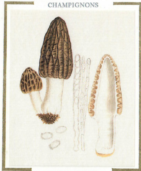
MORILLE CONIQUE Morchella Conica